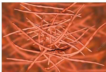
Obrázek 1. Ilustrační foto aktinobakterie z rodu Phytohabitants

Phytohabitoly A-C [1] jsou nově izolovanými \delta -laktonovými makrolidy izolovanými z velice vzácných aktinobakterií (gram pozitivní bakterie) rodu Phytohabitants (Obrázek 1). Aktinobakterie se za posledních 80 let staly obrovským zdrojem nových biologicky aktivních látek které našly využití jak v podobě léků, tak v podobě chemických sond sloužících ke zjišťování biochemických procesů v buňkách a organismech. [2] Překvapivě většina výzkumu byla prováděna na gram pozitivních bakteriích rodu Streptomyces . Sekundární metabolity z aktinobakterií rodu Phytohabitants , poprvé izolovány z kořenů orchidejí pocházejících z ostrova Okinawa, Japonsko, jsou tak naprosto neznámé. Tento fakt tak podnítil nové studie, jež se zaměřili na izolaci a identifikaci nových látek pocházejících z těchto gram pozitivních bakterií. V roce 2022 tak byly phytohabitoly A-C izolovány v rámci této studie. U těchto látek byla následně prokázána zajímavá antitrypanosomální aktivita vůči Trypanosoma cruzi ( IC_{50} = 6-18\mu M ). Zájem naší výzkumné skupiny o tyto látky je studium synergických efektů mezi vysokomolekulárními peptidy a makrolidy nebo polyketidy. [4,5] Nejprve však musíme dané látky připravit a v případě nově izolovaných přírodních produktů i potvrdit jejich strukturu.