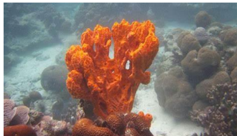
Obrázek 1. Ilustrační foto houby z rodu Homophymia

Enigmazoly A-E [1] jsou nově izolovanými makrocyclickými laktony pocházejícími z nově identifikované mořské houby rodu Homophymia (Obrázek 1). Tento typ mořských hub se za posledních 20 let stal naprostou studnicí nových typů látek, zejména pak makrolidů, které naprosto oplývali nepřeborným množstvím biologické aktivity, z nichž nejdůležitější pak byla aktivita protinádorová a neuroprotektivní. [2] Asi nejdůležitějšími látkami z těchto mořských hub jsou pak homophyminy A-E, homophymamidy, pipecolidepsiny a callipetiny – krátce vysokomolekulární peptidy s cytotoxickými a anti-HIV aktivitami. Může být tedy s podivem, proč se náš projekt soustřeďuje na makrolidy, jmenovitě na enigmazol C. Naším dlouhodobým cílem je studium synergických efektů mezi vysokomolekulárními peptidy s makrolidy (makrocyclickými laktony). [3,4] Krátkodobým cílem je pak příprava a potvrzení struktury výše zmíněného makrolidu enigmazolu C.