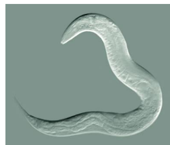
Obrázek 1. Ilustrační foto modelového organismu Caenorhabditis elegans

Helminti (Helminthes) jsou červi parazitující na člověku, zvířatech a rostlinách. Obecně helminti (lidově červi) patří do kmene ploštěnci (Platyhelminthes), hlístice (Nematoda Obrázek 1) nebo vrtejši (Acanthocephala). Z těchto tří kmenů nás v naší výzkumné skupině nejvíce zajímá kmen hlístic (Nematoda) respektive vývoj nových antinematod (látek s tzv anthelmintickou aktivitou vůči nematodům). Nematody jsou všudypřítomné mnohobuněčné organizmy jež každoročně způsobují obrovské ztráty v oblasti rostlinné a živočišné produkce (odhad 10-12% roční úrody) a jsou nebezpečné i člověku. [1] Existující anthelmintika (např. ivermectin) se bohužel ukazují jako naprosto nedostatečné, neboť se prudce zvyšuje rezistence nematodů vůči jejich aplikaci. [2] Hledání nových látek s anthelmintickou aktivitou je tedy otázkou prvotní důležitosti.